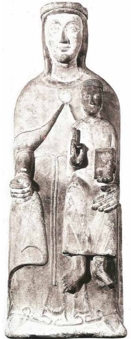
Madonna con Bambino , scultura marmorea trecentesca presente fino al 1925 nella chiesa di S. Maria Maddalena di Oriago ed ora conservata nella Pinacoteca del Seminario Patriarcale di Venezia

(Per le notizie si è fatto riferimento in particolare al sito del Seminario Patriarcale)