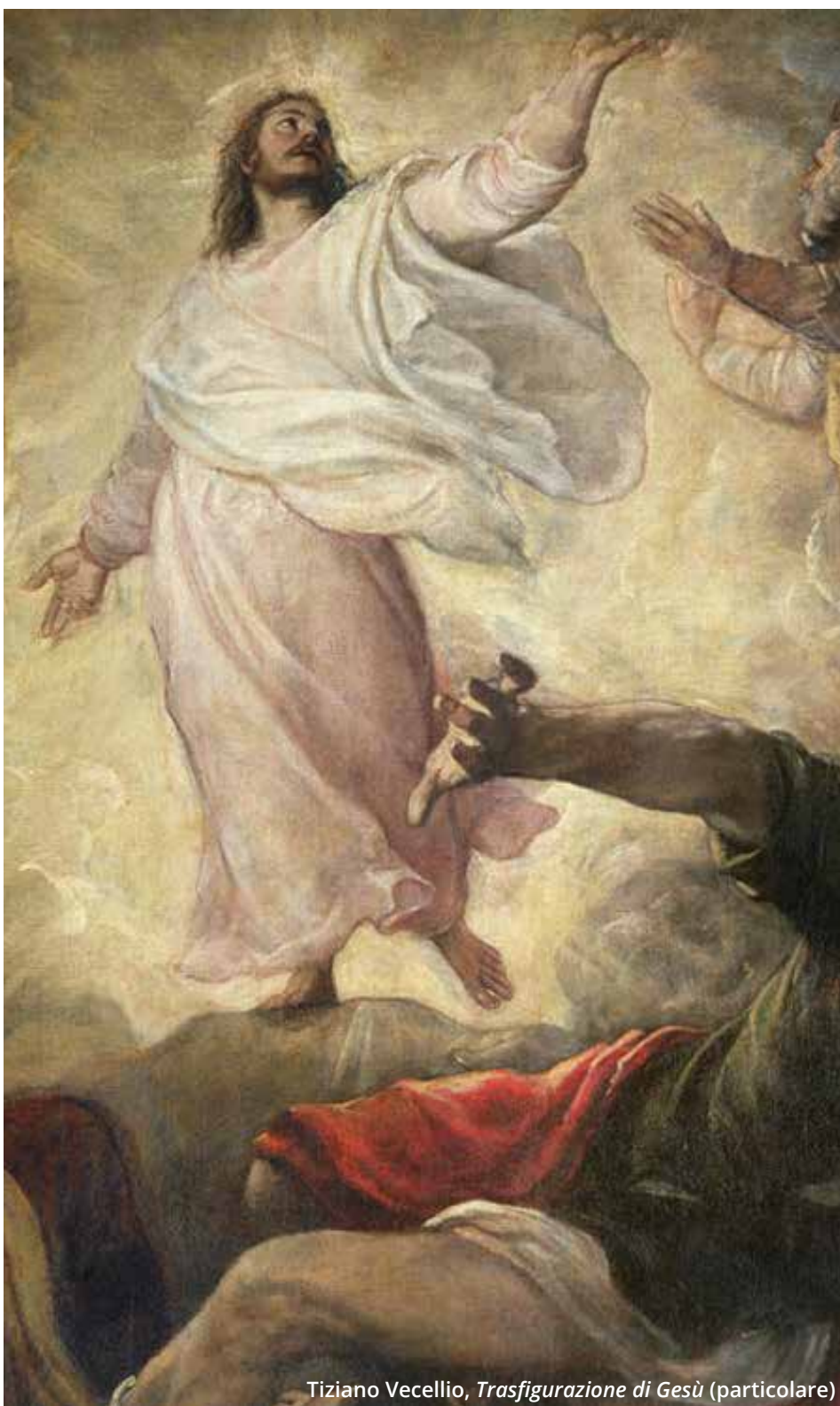
Tiziano Vecellio, Trasfigurazione di Gesù (particolare)